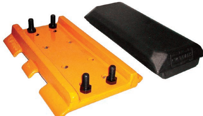
Sada pro finišery