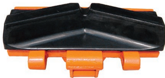
Sada pro dozery

Výhody jsou nasnadě. Pryžový blok je kompaktnější než vrstva kopírující tvar desky. Jeho pojezdový povrch je jednolitý, není narušen otvory pro hlavy šroubů připevňujících desku k řetězu pasu. Tyto faktory, spolu s užitím přírodního kaučuku umožňují bezkonkurenční odolnost proti opotřebení otěrem a proti poškození typu trhlin od otvorů pro šrouby nebo odtržení od desky.