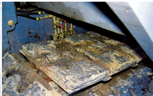
Běžná deska po roce stejného nasazení