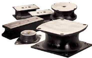
Sortiment tlumicích prvků

Firma věnuje maximální pozornost jak vlastnímu vývoji – na letošním veletrhu Bauma v Šanghaji plánuje představit další inovaci výměnných gumových desek – tak i zajištění nejvyšší kvality svých výrobků. Technologicky méně náročná výroba využívá nízkých nákladů výroby v Číně, zatímco vývoj a technologicky špičková výroba zůstává na Taiwanu.