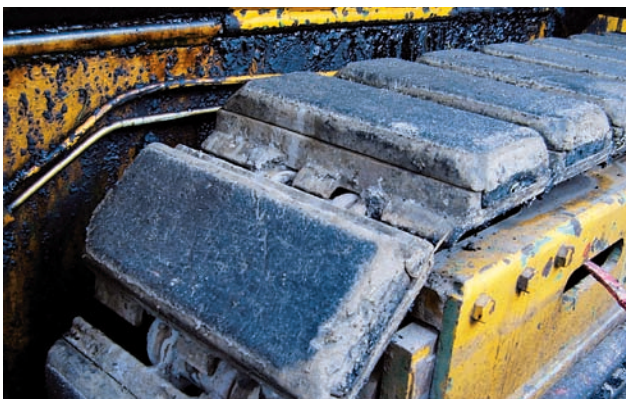
Deska Everpads po roce nasazení na stavbě dálnice

Taiwanská firma Everpads šla jinou cestou. Eliminovala poměrně náročný úkol spojit vrstvu pryže s jednou stranou složitějšího tvaru kovové pojezdové desky a namísto toho zalila do pryže jednodu-